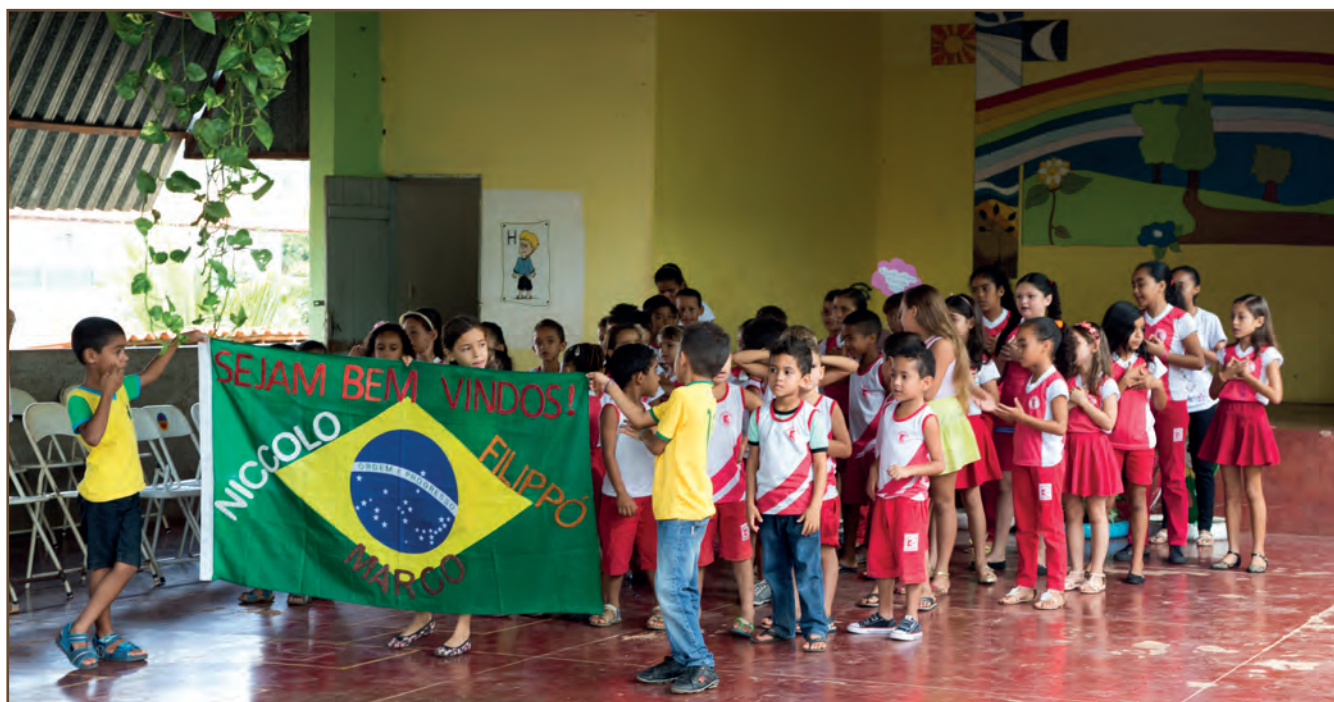
L'accoglienza alla Fondazione Candia da parte degli alunni della scuola elementare Kolping

Con grande soddisfazione da tre anni sta regolarmente funzionando la nostra scuola Kolping in São José, che tecnicamente è una filiale della scuola più grande che ha sede in Dom Pedro, già funzionante da alcuni anni e