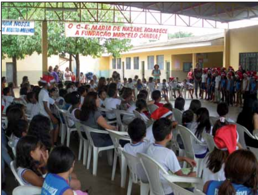
A lato, il Salone coperto nel giorno dell'inaugurazione. Sul fondo si scorgono alcune aule.

dello Stato della Rondonia, che paga funzionari e professori. Il Direttore e il Vice-direttore sono indicati dal vescovo Dom Moacyr Grechi, il quale si prodiga in modo speciale per offrire a questa comunità una scuola orientata all'educazione integrale, attenta all'educazione dell'intelligenza, del corpo, del cuore e dell'anima per formare cittadini coscienti e capaci di essere protagonisti del loro futuro. Contrariamente, nelle scuole pubbliche, l'educazione lascia molto a desiderare e non dispone di risorse sufficienti. Di fronte a questa realtà di grande miseria, la nostra scuola è diventata un punto di riferimento molto importante per la vita e la formazione dei bambini e dei giovani che la frequentano. È