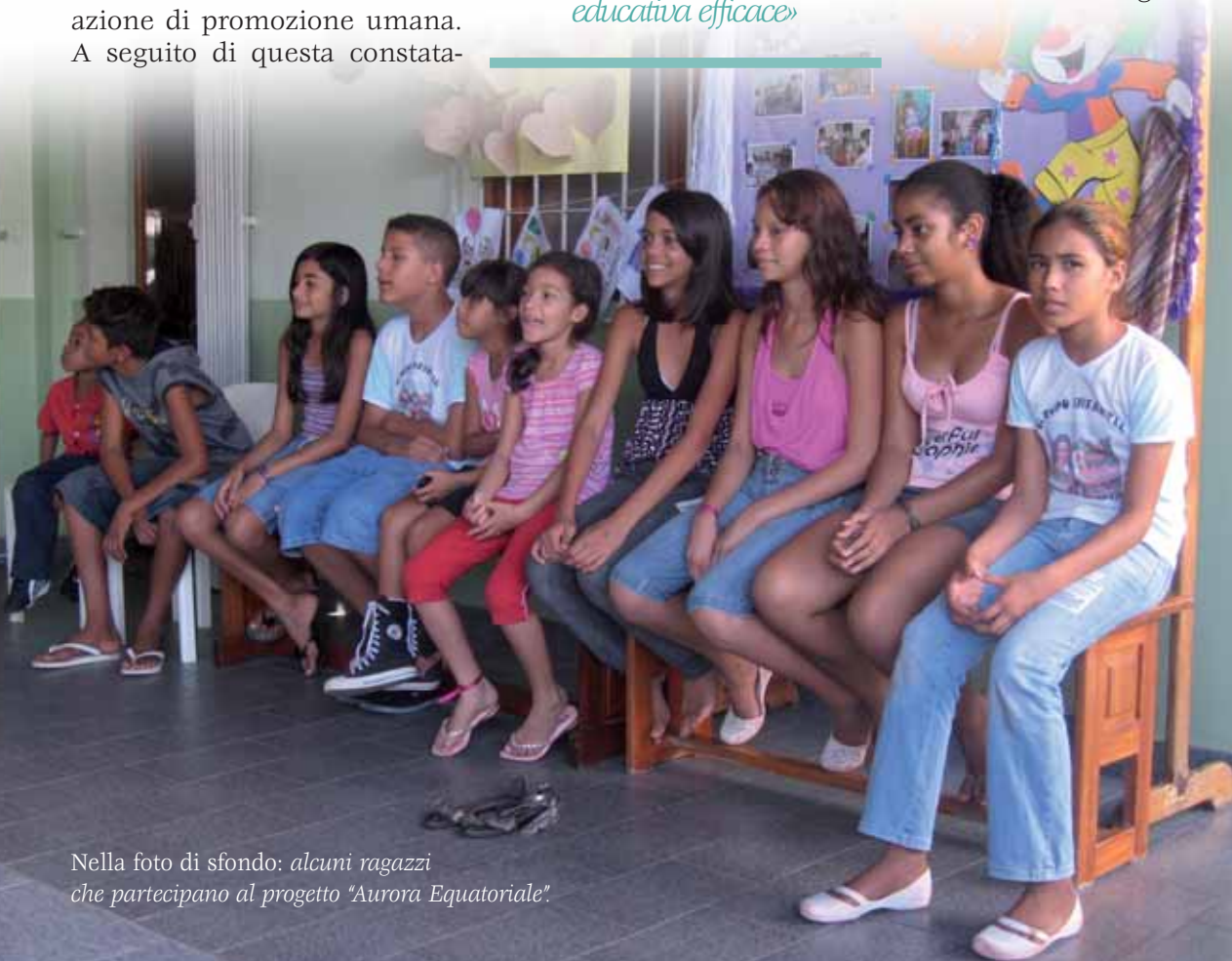
Nella foto di sfondo: alcuni ragazzi che partecipano al progetto "Aurora Equatoriale".

la sua crescita sotto ogni aspetto. Insieme ad alcune persone professionali volontarie, abbiamo creato uno spazio per gli adolescenti e per le loro famiglie. È nato il progetto Aurora Equatoriale: "Aurora" significa nuovo mattino con nuove opportunità di vita nuova; è una luce sottile che si espande sino al suo massimo splendore. "Equatoriale" per il chiaro riferimento al contesto geografico della città di Macapà che è attraversata dall'Equatore. Con il contributo della Fondazione Candia è stato possibile ristrutturare gli ambienti