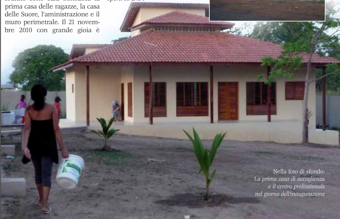
Nella foto di sfondo: La prima casa di accoglienza e il centro professionale nel giorno dell'inaugurazione